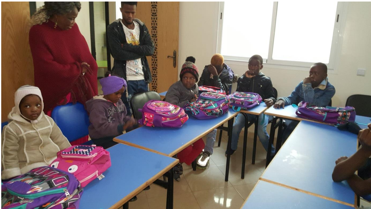
Classe d'élèves allophones à Salé (Association AMIDI)

Si 25 élèves bénéficient d'un encadrement scolaire, un grand nombre d'enfants et adolescents d'origine subsaharienne, à Salé, n'est pas encore scolarisé.