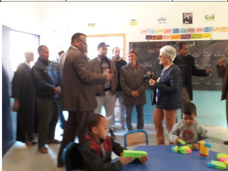
En visite avec Monsieur Louihi qui pilote le PMP3